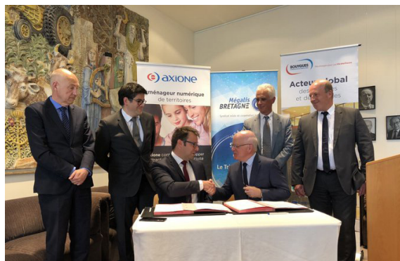
Signature du contrat à Rennes, le 20 mars dernier

Mégalis Bretagne a choisi de retenir le groupement Axione – Bouygues Energies & Services pour concevoir et réaliser le déploiement de la fibre optique dans la région bretonne, dans le cadre des phases 2 et 3 du projet Bretagne Très Haut Débit.